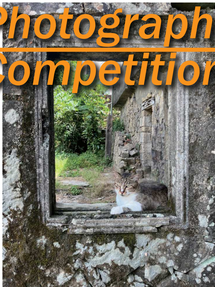
金獎 - 林敬雅 - 刻苦銘心