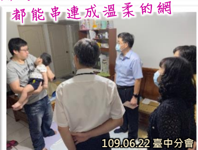
都能串連成溫柔的網