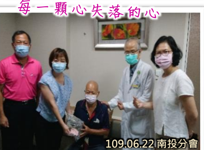
每一顆心失落的心