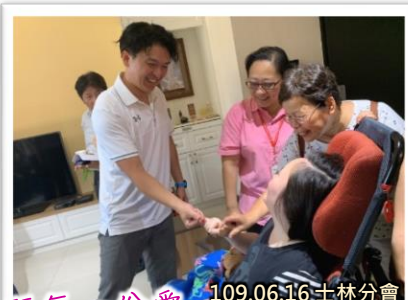
願每一份愛 109.06.16 士林分會