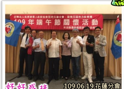
好好盛接 109.06.19 花蓮分會